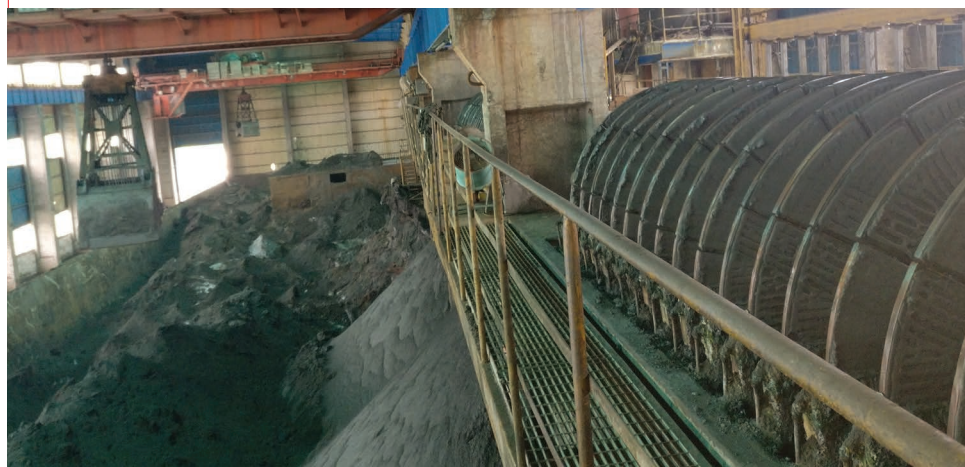
Le filtre à disques en céramique Flowrox est particulièrement efficace pour la filtration des résidus de cuivre.

Le principe de fonctionnement en continu du filtre CD de Flowrox simplifie l'automatisation et l'utilisation de la machine. Il améliore également sa fiabilité.