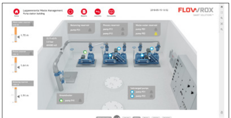
Station de pompage EKJH et vue à distance dans Flowrox Malibu.