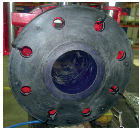
Полиуретан широко используется во всех сферах для защиты деталей и компонентов от абразивного износа и истирания.

Для оптимальной и бесперебойной работы регулирующих клапанов компания Flowrox обеспечивает правильный выбор требуемой вставки, соответствующий всем, в том числе специфическим, потребностям заказчика. Профессиональный опыт специалистов Flowrox подкреплен более чем 8000 поставок по всему миру для регулирования высокоабразивных сред.