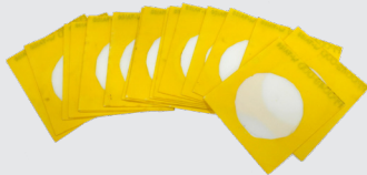
13. Telas del filtro