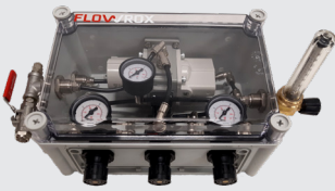
10. Panel de control