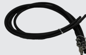
15. Mangueras, 4 piezas