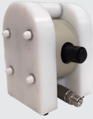
7. Bomba de lodo