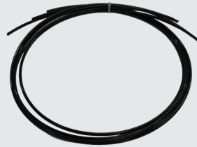
11. Tubos de aire, 3 piezas