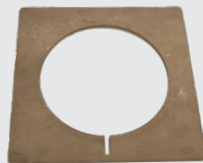
14. Placa de prensa delgada