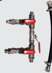
12. Tubería de alimentación y manguera corta